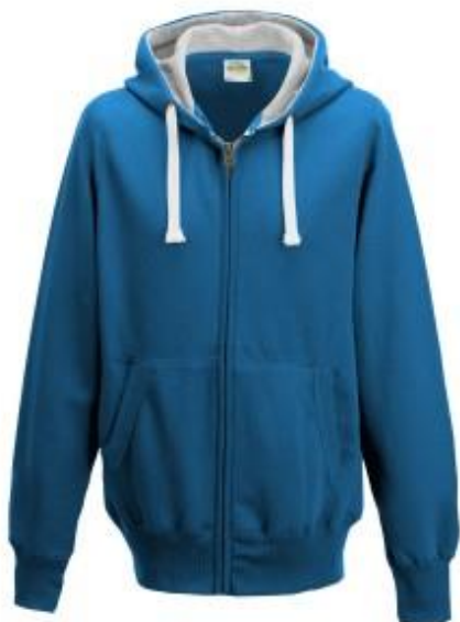
Abb. Zipper: https://justhoodsbyawdis.com/product/jh052

Als Sponsor des Pakets Platin „Zipper“ bucht ihr unser großes Paket. Ihr erhaltet die gleichen Leistungen wie ein Gold-Sponsor und sponsert zusätzlich das Veranstaltungs-Giveaway in Form eines Hoodies bzw. Zippers, siehe Abbildung.