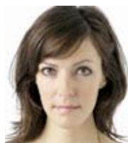
Simone Fischer Veranstaltungen