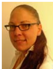
Ute Staats Finanzen