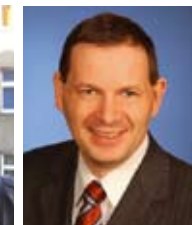
Fried Saacke Geschäftsführer