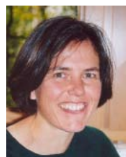
Claudia Wagner Layout und Satz