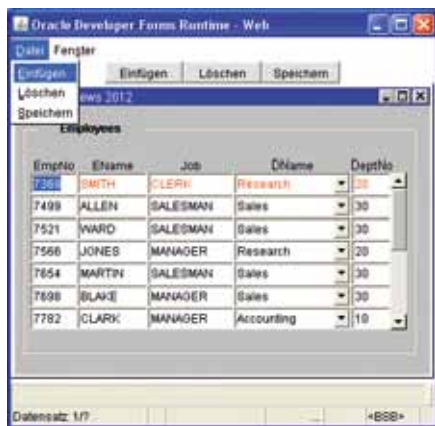
Abbildung 1: Applikation mit Menü und Toolbar

Funktionen wie zum Beispiel Einfügen, Löschen oder Speichern werden dem Anwender in einer guten Applikation immer mehrfach zur Verfügung gestellt – als Hotkey, über das Menü und auch als Toolbar-Button (siehe Abbildung 1). Wichtig ist hierbei, dass der dahinterliegende Source Code nicht mehrfach geschrieben wird.