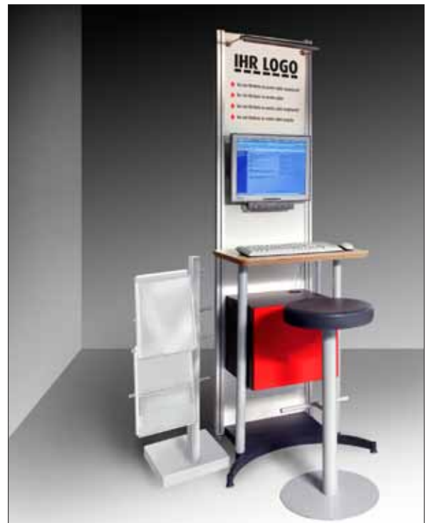
Präsentationsplatz mit Monitor, Mouse, Tastatur, Beschriftung, 1 Stehhilfe und Prospektständer

In der Ausstellungsfläche liegt ein brauner Parkettboden und ein roter Teppich. Sämtliche Verklebungen, die mit Klebebändern auf dem Parkettboden vorgenommen werden müssen, sind vorher immer mit „tesakrepp 4329“ zum Schutz des Parkettbodens abzukleben.