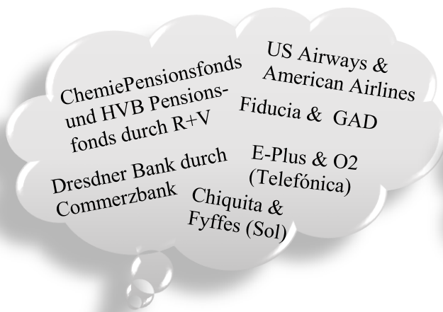
Fusionen / Mergers & Acquisitions (Auszug)

Entsprechend facettenreich gestaltet sich auch in den letzten Jahren die Liste der Fusionen – und die Liste der Insolvenzen: