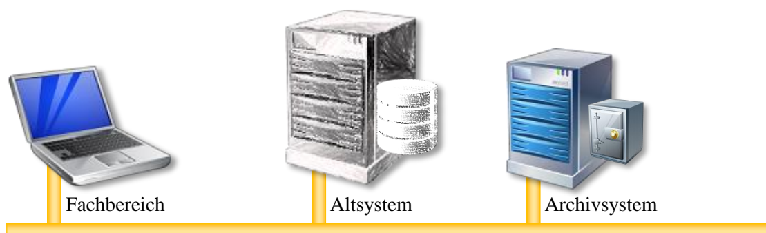
Abbildung 3: IT-Architektur bei Application Retirement oder Abschaltung der IT-Infrastruktur im Rahmen einer Insolvenz

Am besten legt man zu diesem Zeitpunkt fest, welche Systeme GoBS- bzw. GDPdU-relevante Daten enthalten und welche Aufbewahrungsfristen dafür gelten. Anschließend muss betrachtet werden, welche weiteren Systeme ebenfalls für eine Archivierung aus anderen Regelungen und Gesetzgebungen berücksichtigt werden müssen. Gründe dafür kann beispielsweise die Produkthaftung bei fertigenden Unternehmen sein. Unter Berücksichtigung der Abwicklungszeiten sollte man anschließend einen Zeitplan anfertigen, wann welche Applikation als read-only-System genutzt werden kann. Sind langfristig Buchungen abzusehen, so ist ggf. eine zwischenzeitliche Migration der Daten in ein System denkbar, das dem Geschäftsbetrieb während der Insolvenz entspricht – und nicht während des früheren operativen Betriebs. Auch hierfür ist das Application Retirement der richtige Ansatz, wenn nur die aktiven Daten in das Buchungssystem übernommen werden und alle Daten archiviert werden.