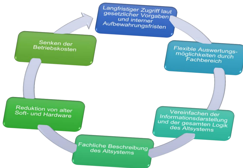
Abbildung 1: Ziele des Application Retirements

Somit ergeben sich folgende Punkte für das Application Retirement: