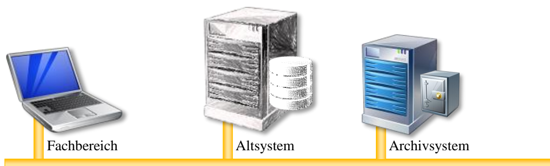
Abbildung 3: IT-Architektur bei Application Retirement oder Abschaltung der IT-Infrastruktur im Rahmen einer Insolvenz

Am besten legt man zu diesem Zeitpunkt fest, welche Systeme GoBS- bzw. GDPdU-relevante Daten enthalten und welche Aufbewahrungsfristen dafür gelten. Anschließend muss betrachtet werden, welche weiteren Systeme ebenfalls für eine Archivierung aus anderen Regelungen und Gesetzgebungen berücksichtigt werden müssen. Gründe dafür kann beispielsweise die Produkthaftung bei fertigenden Unternehmen sein. Unter Berücksichtigung der Abwicklungszeiten sollte man anschließend einen Zeitplan anfertigen, wann welche Applikation als read-only-System genutzt werden kann. Sind langfristig Buchungen abzusehen, so ist ggf. eine zwischenzeitliche Migration der Daten in ein System denkbar, das dem Geschäftsbetrieb während der Insolvenz entspricht – und nicht während des früheren operativen Betriebs. Auch hierfür ist das Application Retirement der richtige Ansatz, wenn nur die aktiven Daten in das Buchungssystem übernommen werden und alle Daten archiviert werden.