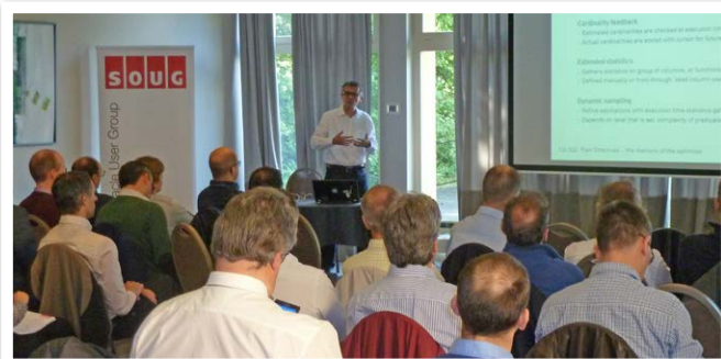
Performance, wohin man schaut