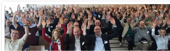
Die Apex Community beim Aufwärmen