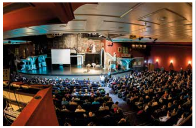
Die Eröffnung der JavaLand 2014

Parallel zum Start des Call für Presentation für die JavaLand 2016 startet das Organisationskomitee auch die Planung der zahlreichen Community-Aktivitäten. Ziel dieser Aktivitäten ist es, den Teilnehmern beim Einstieg in die Praxis zu helfen. Dazu wird es in der Community-Hall viele Gelegenheiten zum Experimentieren geben.