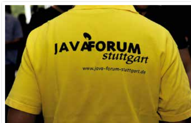
Impression vom Java Forum Stuttgart

Mit einer Rekordbeteiligung von mehr als 1.600 Teilnehmern findet zum 18. Mal das Java Forum in Stuttgart statt. Die Java User Group Stuttgart hat 49 Vorträge in sieben parallelen Tracks organisiert. Der iJUG nutzt die Gelegenheit, um den Verein und die Zeitschrift „Java aktuell“ zu präsentieren.