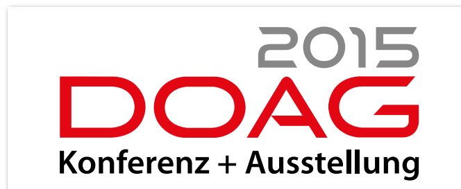
Das Logo der DOAG 2015 Konferenz + Ausstellung

Der DOAG-Vorstand beschließt auf einer Sitzung in München mit Vertretern der Swiss Oracle User Group (SOUG), der Austrian Oracle User Group (AOUG) und von Oracle sowie mit den Streamleitern das Programm zur DOAG 2015 Konferenz + Ausstellung. Nach einem neuen Rekord von rund 850 Vortragsbewerbungen wird ein zusätzlicher Vortragsraum eingeplant. Die ausgewählten Vorträge versprechen wieder eine interessante und spannende Veranstaltung.