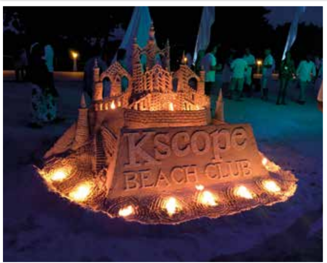
Ein Community-Event jagt den anderen