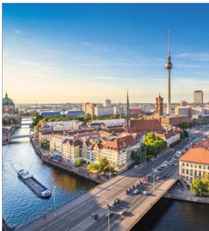
Auf der Spree unterwegs

Vertreter des Interessenverbands der Java User Groups e.V. (jUG) kommen nach Berlin in die DOAG-Geschäftsstelle, um die Einführung des Planungs- und Kommunikationssystems Redmine vorzubereiten. Am Abend findet gemeinsam mit dem DukeCon-Projektteam eine Bootsfahrt auf der Spree statt.