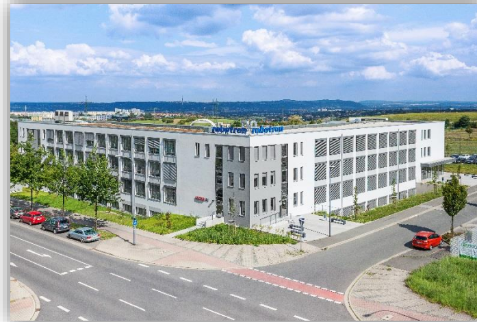
Congress and Training Center